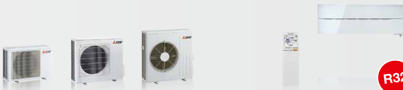
MUZ-LN25 / 35VG2